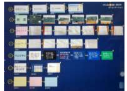
↑児童が残した「スタディ・ログ」