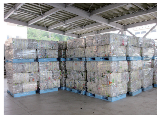
↑ペットボトル圧縮梱包品貯留ヤード