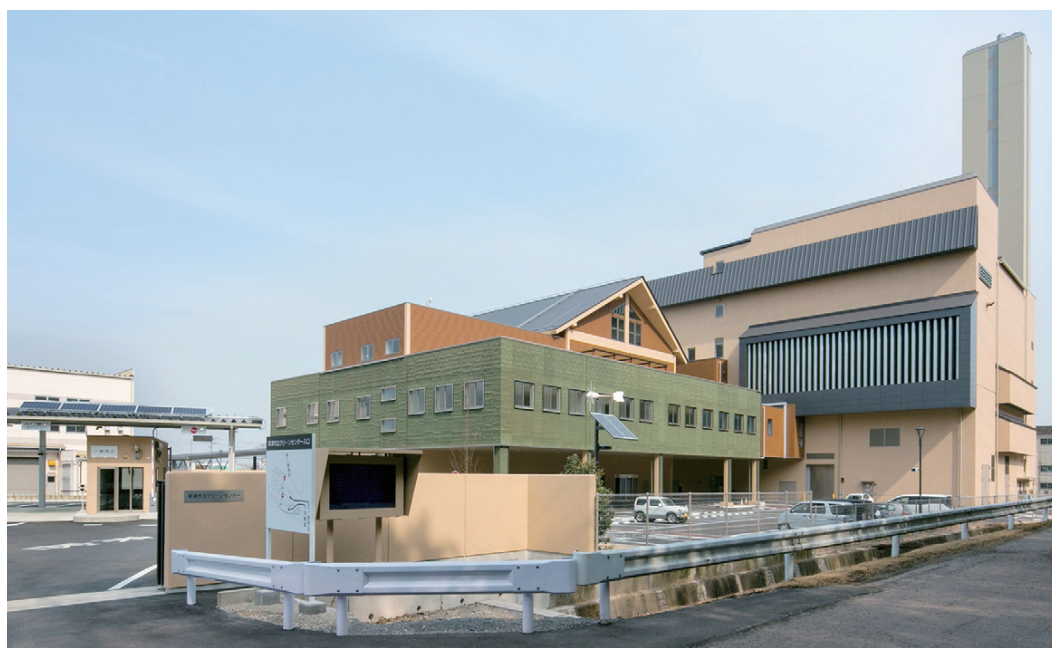
↑クリーンセンター