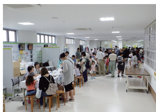
リサイクルフェア