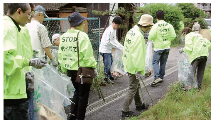
↑ポイ捨てパトロール