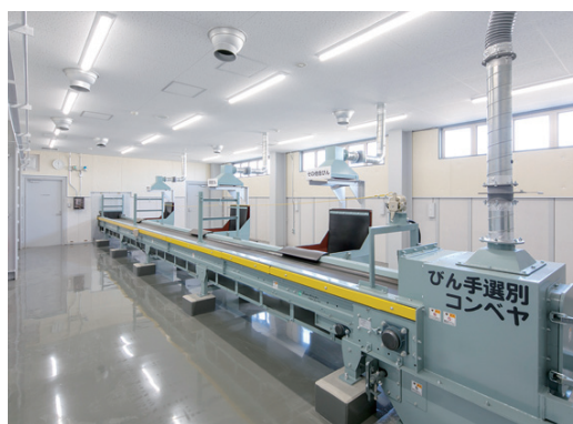
↑びん手選別コンベヤ