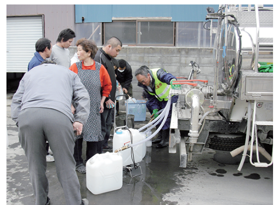
↑ 草津市のしよく員の様子

石巻に加えて、岩手県大槌町・福島県小野町・石川町・三春町へもひ害を受けた住民のみなさんの支援活動にあたりました。