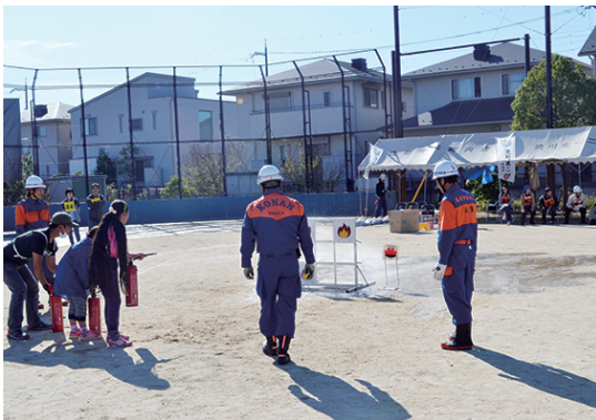
↑水消火器を使った消火訓練