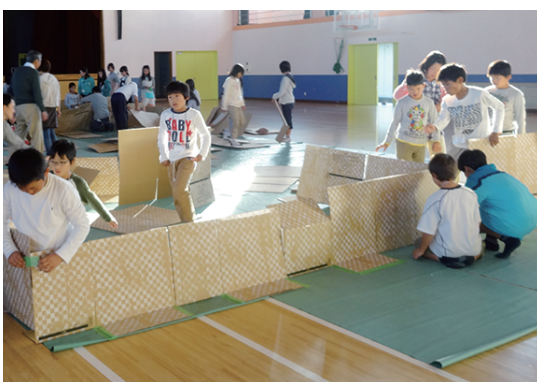
↑だんボールを使ったひなん所宿はく体験