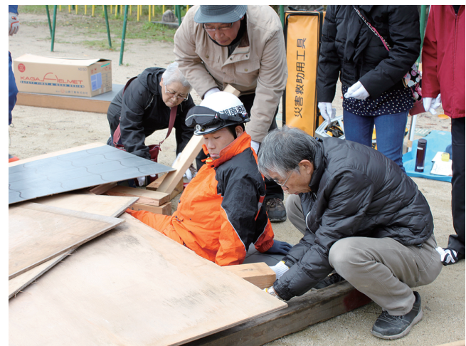
↑地域住民も参加しての救助救急訓練

これらの訓練を行うことで、小学生のあなたにできることがあるということを感じてほしいです。