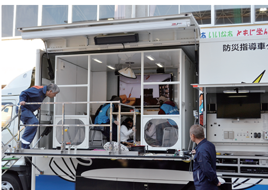
↑グラドン号での地震体験