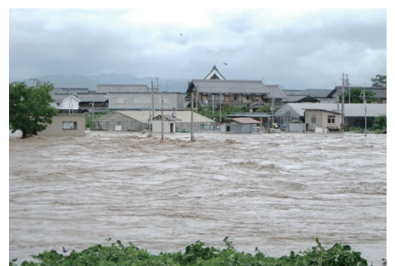
↑ 姉川が増水した時の様子 【難波橋下流：H29.8.7～8】

滋賀県は、周囲に海がありません。そのため、津波の心配は、海が近くにある都道府県よりも少ないと考えられます。しかし、過去には伊吹山地（米原市）にたくさんの雨が降ったため、姉川（長浜市）が増水したこともありました。