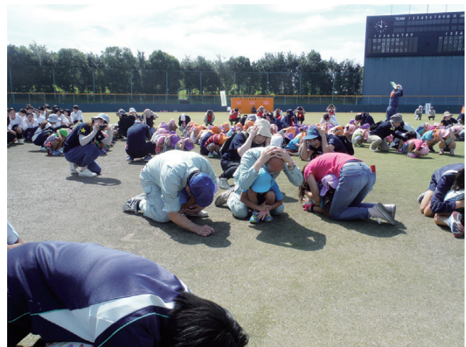
↑草津グリーンスタジアムでの訓練の様子

地震がおこったという設定で、市内いっせいによびかけの放送とサイレン音が鳴り、最初の1分間「まず低く、頭を守り、動かない」ということをみんなで行いました。いざというときに、自分の命を守るためにどう動けばよいか、みんなを考えていくための訓練です。