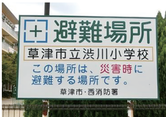
↑ ひなん場所のかん板