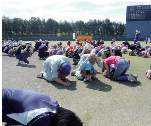
草津グリーンスタジアムでの訓練の様子

地震が起こったという設定で、市内いっせいによびかけの放送とサイレン音が鳴り、最初の1分間「まず低く、頭を守り、動かない」ということをみんなで行います。いざというときに、自分の命を守るためにどう動けばよいか、みんなで考えていくための訓練です。