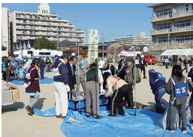
地いきの人と消防しょや消防団で協力して行う防災訓練