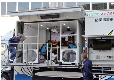
グラドン号での地震体験