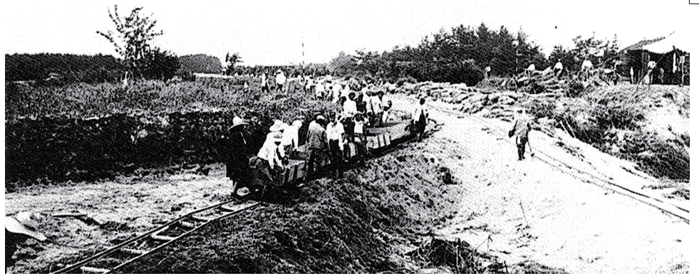
↑1938（昭和13）年、大雨で、ていぼうが切れた草津川を直す様子