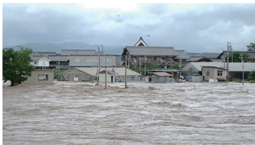
↑2017(平成29)年 姉川の増水