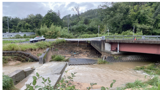
↑2021(令和3)年 草津市土砂災害