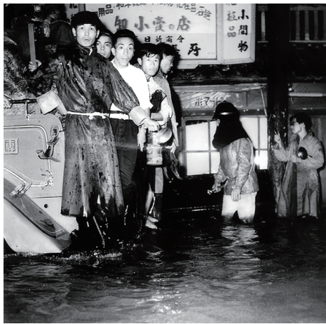
↑1953（昭和28）年の台風13号による水害で、ひざ上までしん水した様子