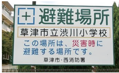
↑ ひなん場所をしめすかん板