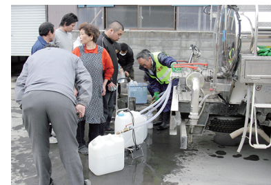
↑草津市の職員の様子

石巻市に加えて、岩手県大槌町・福島県小野町・石川町・三春町でも、ひ害を受けた住民のみなさんの支援活動にあたりました。