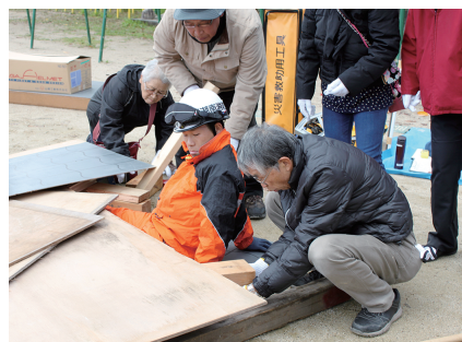
地域住民も参加しての救助救急訓練