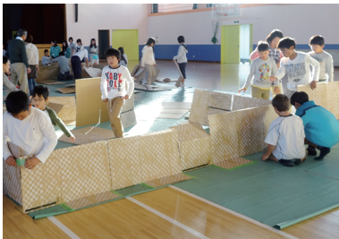
だんボールを使ったひなん所宿はく体験